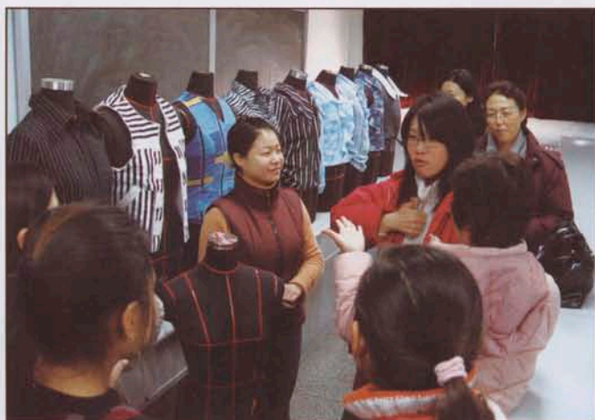
香港聋人高中学生来访