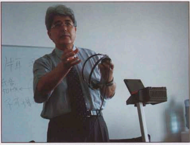
2004年日本筑波技术短期大学校长 大昭直纪教授来我院讲学