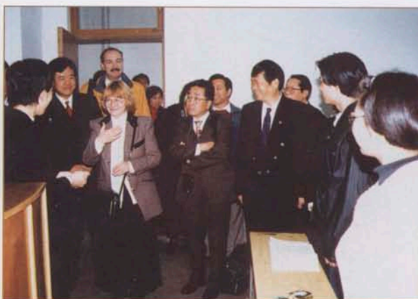
天津理工大学与美国罗杰斯特理工学院合作协议签字仪式 Ceremony of Cooperative Agreement between TUT and RIT