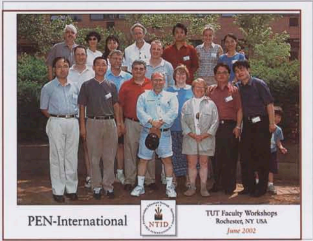
2002年我院青年教师访问美国