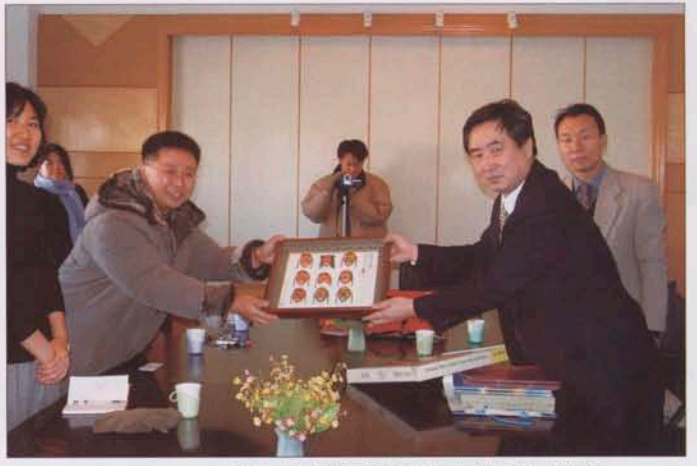
2004年韩国那萨勒大学访问我院