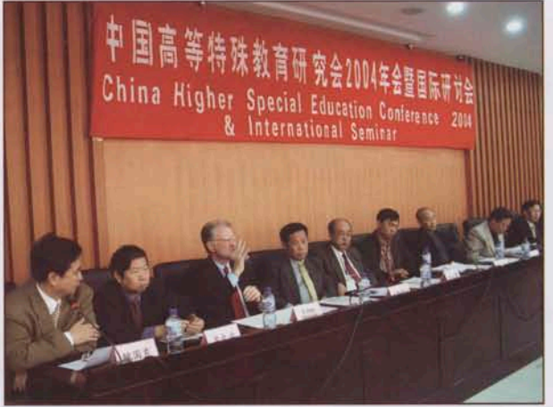
2004年国际高等特殊教育研讨会在我校召开