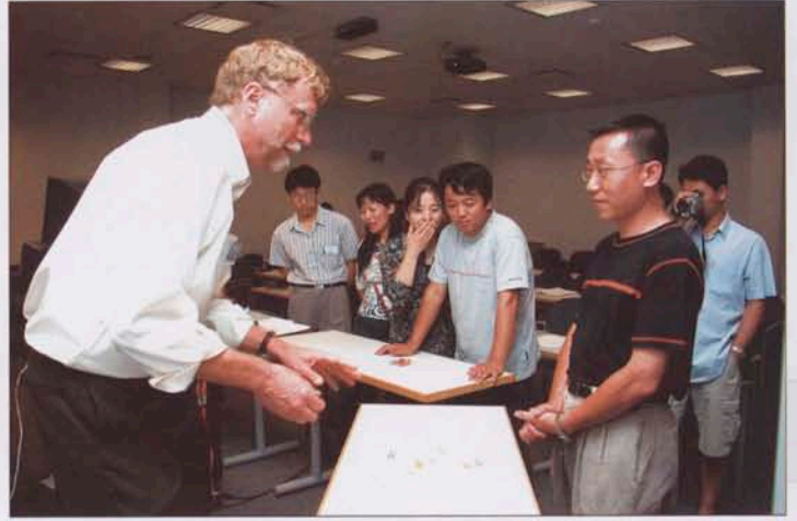
我院教师在美国国家聋人工学院接受培训