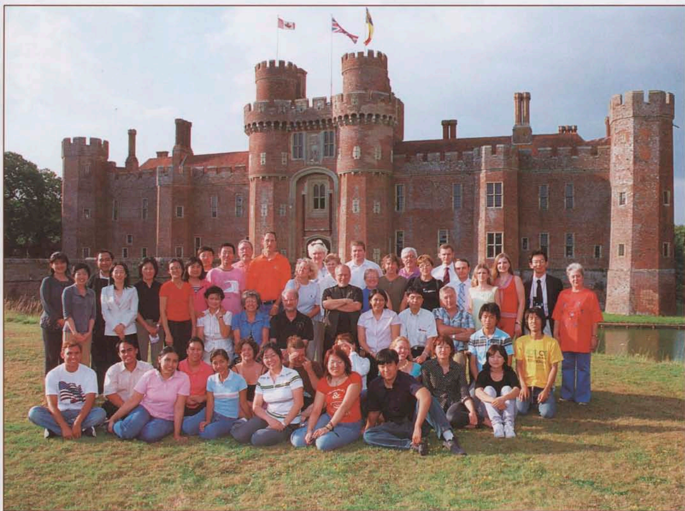
我院师生在英国交流