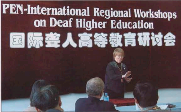
2002年我院召开国际聋人高等教育研讨会