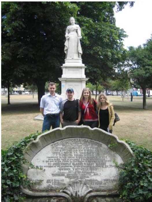
Рядом с королевой Викторией!