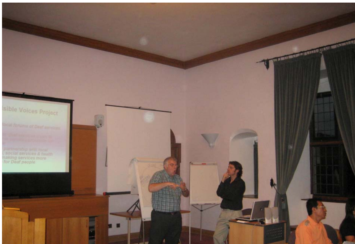
"Культура глухих людей в Великобритании"(J. Hay, G. Hay).