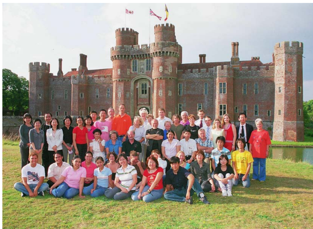
Все участники Летнего Института Лидерства!