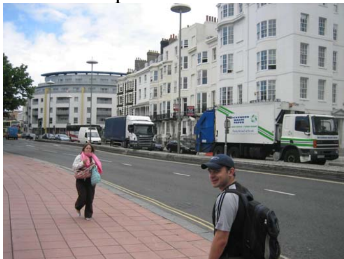
Гуляем по городу!