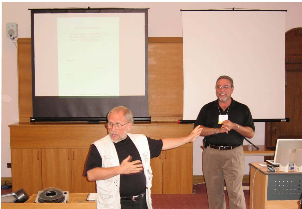
"Развитие эффективных навыков в общении и ведении переговоров " (J. DeCaro & M. Rosica).