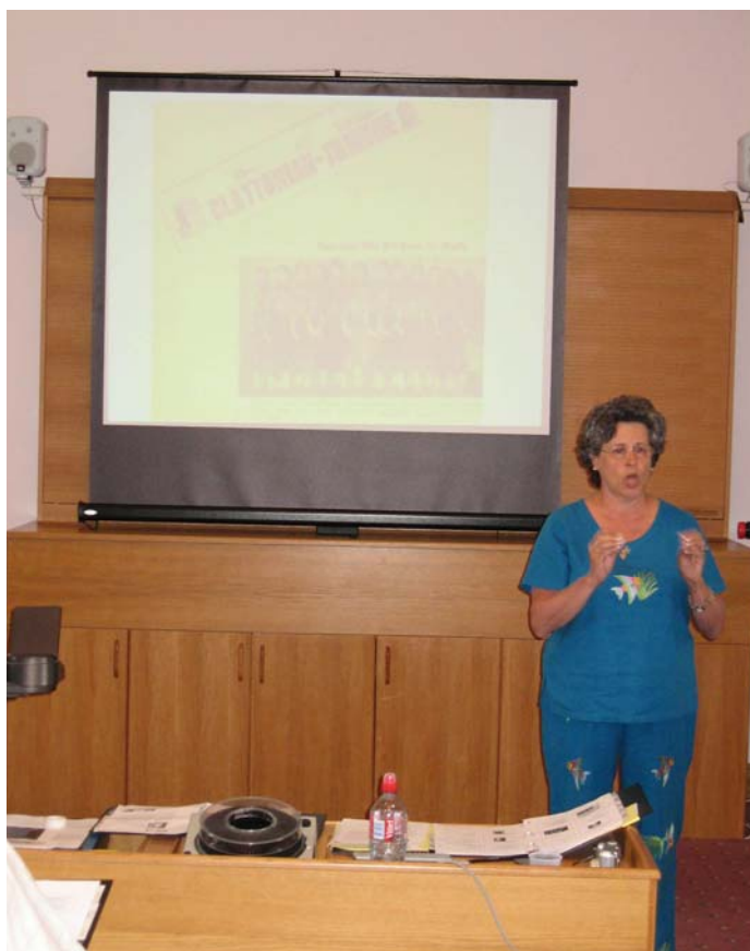
"История глухих лидеров" (P. DeCaro, V. Hurwitz).