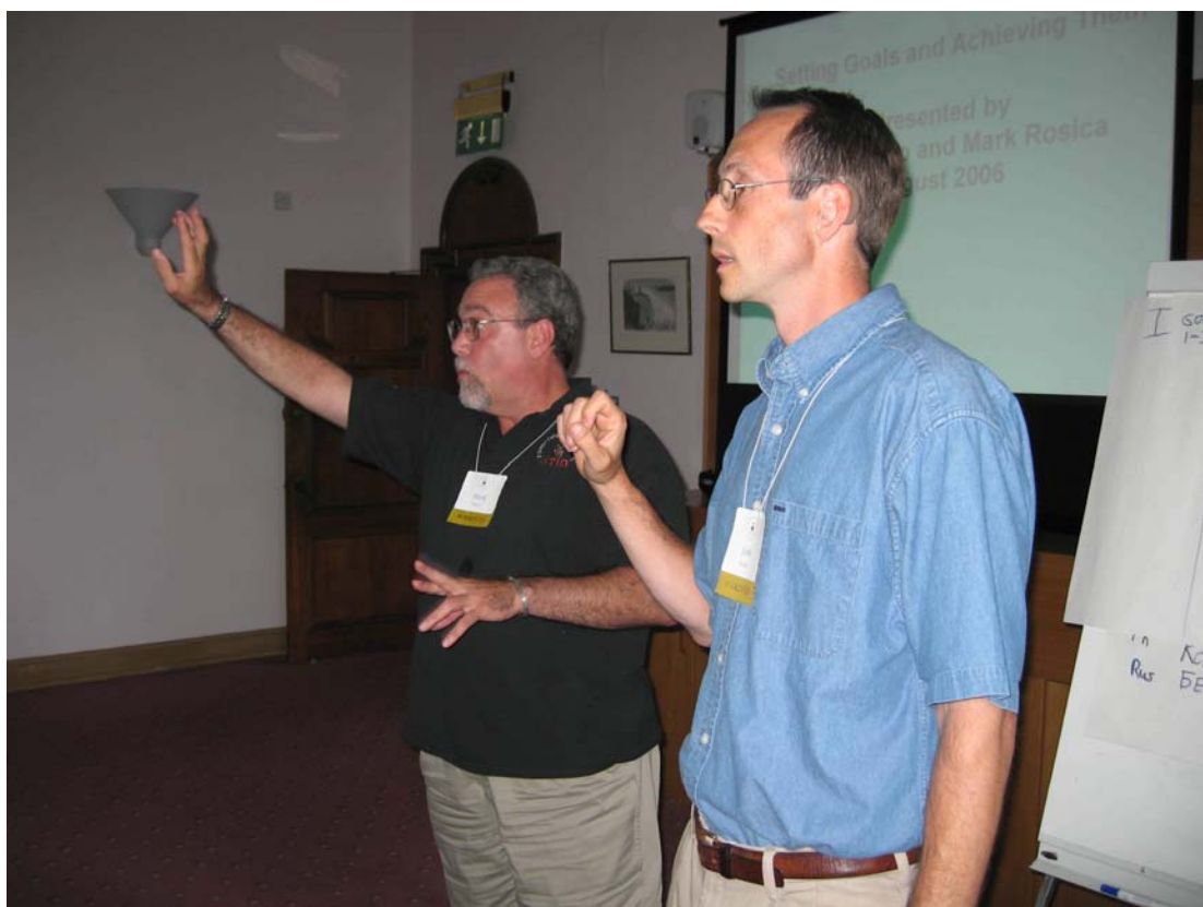
"Лидерство и его разновидности" (P. DeCaro & M. Rosica).