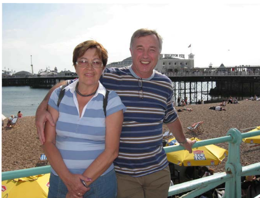
Наш декан с очаровательной супругой!