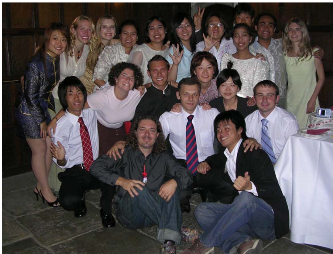
Студенты всех 5 стран!