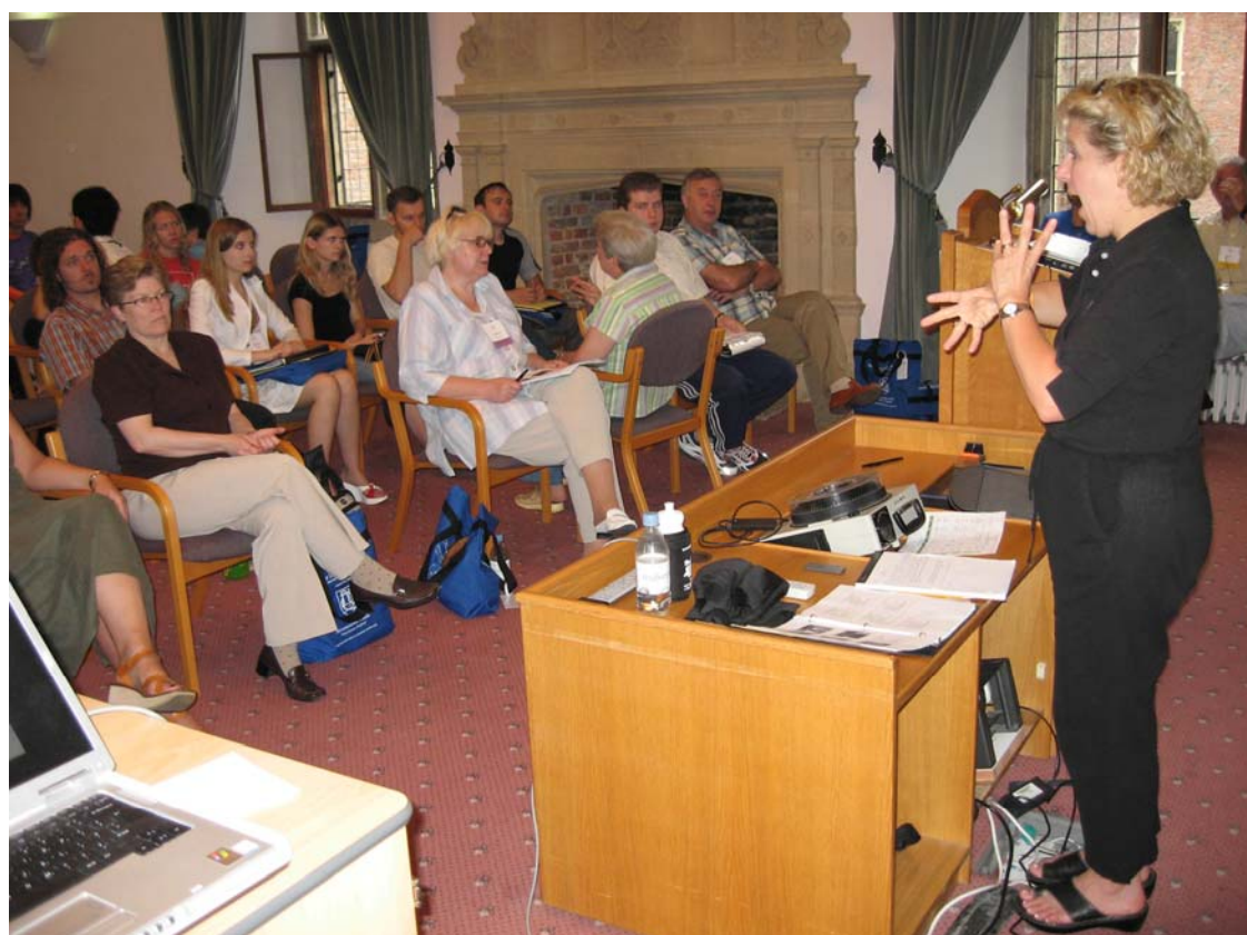
"Защищайте свои права к доступу информации при обучении в колледже " (D. Kavin & A. Hurwitz).